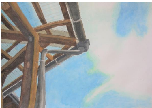
「わたりろうかと屋根と空」 中村 詩