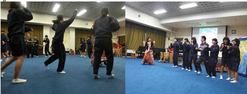
アフリカ トーク&ライブ の一場面