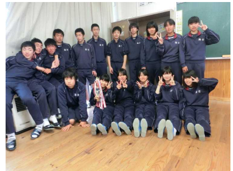
3年生 漢字大会 百点率勝利